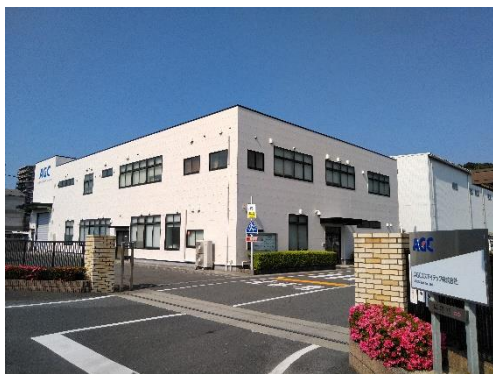
AGC エスアイテック本社

AGC（AGC株式会社、本社：東京、社長：平井良典）の100%子会社であるAGCエスアイテック株式会社（以下 AGCエスアイテック、本社：北九州市若松区）は、天然由来の素材を使用した環境に優しい化粧品原料であるシリカ製品RESIFA™ SUNSPHERE® の生産能力増強を決定しました。同社若松工場（北九州市若松区）で現行の約1.5倍に生産能力を拡張する設備増強を実施し、2025年第2四半期に稼働を開始する予定です。