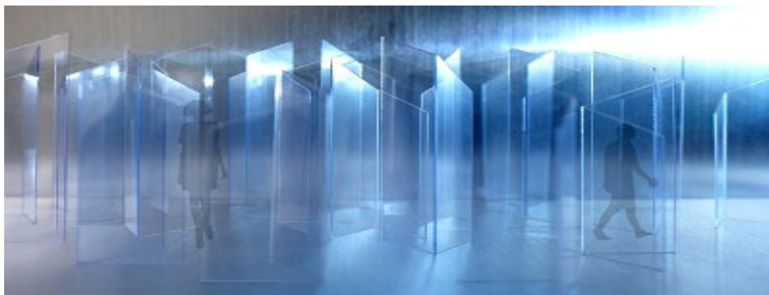
グラシーンをを用いたミラノサローネ展示イメージ

Glascene™は、透明なガラスへの映像投影を可能にしたガラススクリーンです。本展示では、約200平方メートルの会場に、高さ約3mのGlascene™を緻密かつダイナミックに配置することで、ガラスの質感、そしてガラスならではの透過と反射という特性を織り交ぜた新たな映像空間を演出します。inforverre™が映すクリアで美しい映像と共に、展示を通じて 情報のインターフェイスとしてのガラスの可能性 を体感していただけます。