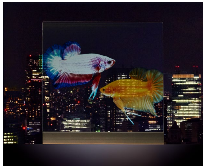
背景を活かした映像投影が特長です。