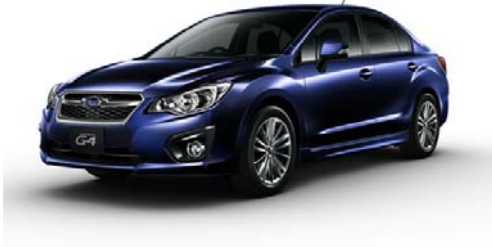
スバル インプレッサ G4