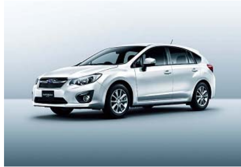
スバル インプレッサ スポーツ